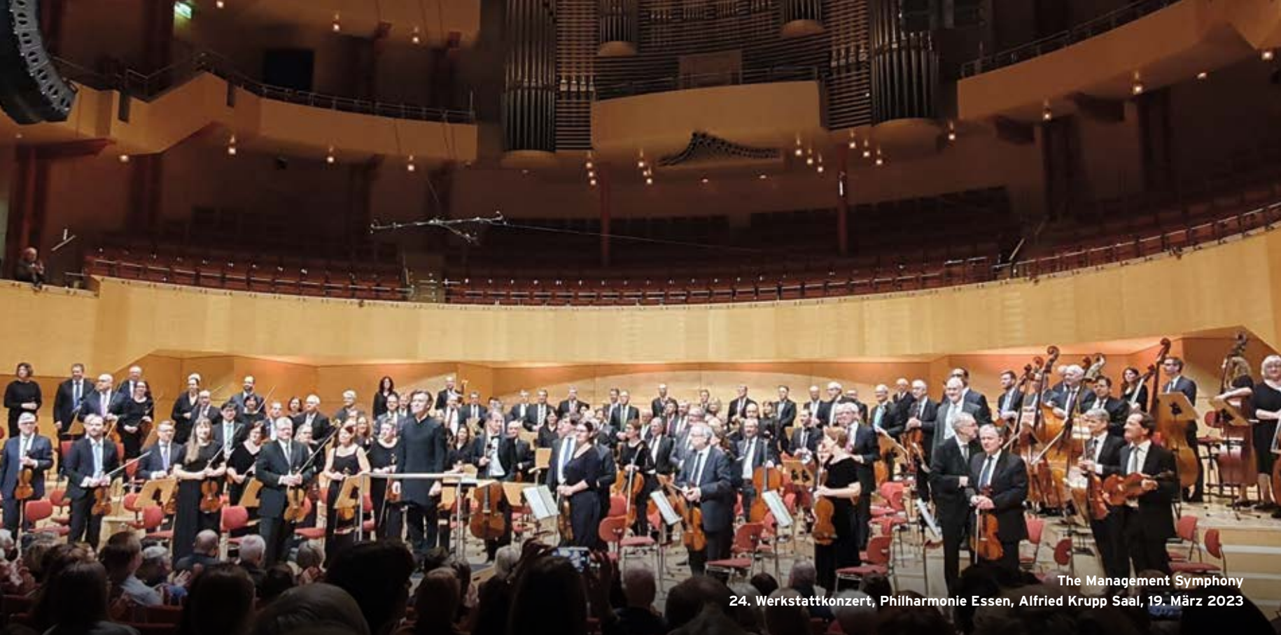
The Management Symphony 24. Werkstattkonzert, Philharmonie Essen, Alfred Krupp Saal, 19. März 2023